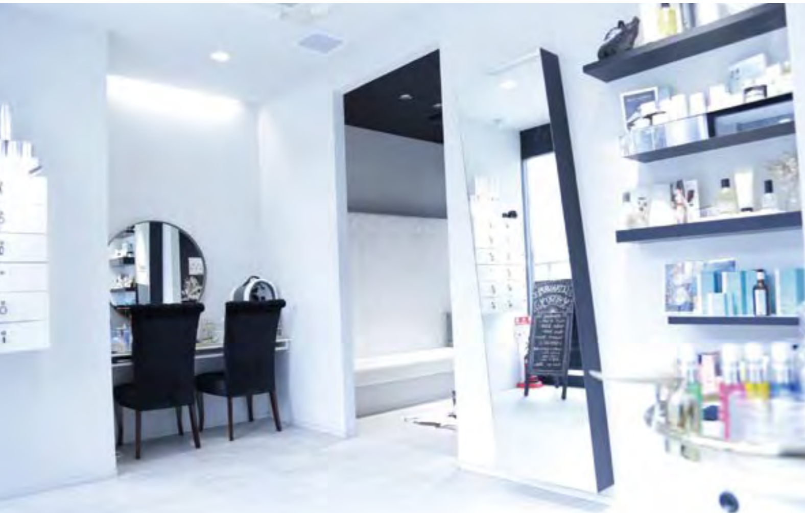
ヘアに限らず、ワンランク上のライフスタイルを提案する商品を多数ご用意。プロフェッショナルなアイテムを是非ご覧いただきたい